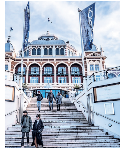
▲ Hanae C. boekte twee nachten in het Kurhaus op kosten van pharmabedrijf Astellas.

Maar de woorden van spijt kwamen wel pas nadat ze na PostNL